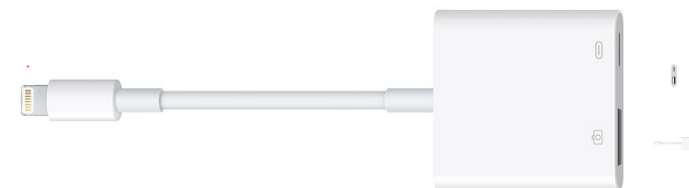
Apple 純正の Lightning - USB3 カメラアダプタ

「できマウス S2。」をカメラアダプタの USB 端子に挿入し、iPad 付属の充電ケーブルをカメラアダプタの Lightning コネクタに挿入しますと