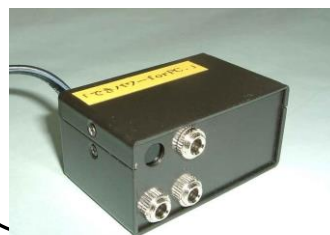
手のひらにおさまる大きさです

だいじょうぶだっチュー！ 「できパワーforPC。」では、すきなスイッチでパソコンのでんげんをいれ、そのあとのそうさもできるっチュー！ きゅうしやスリープやシャットダウンからのふっきもできるっチュー！